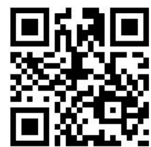
飯小ホームページ