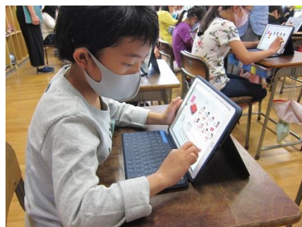
3年：わり算の問題作り