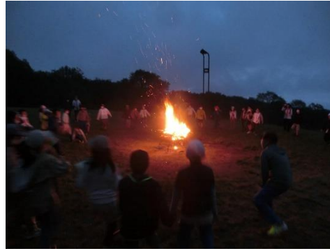
【キャンプファイヤー】